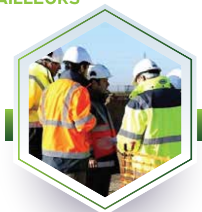
COORDINATION SECURITE - PREVENTION - SANTE (CSPS)

CREPMO définit avec vous, votre solution sur-mesure d'externalisation de la fonction Qualité Hygiène Sécurité et /ou Environnement, en fonction :