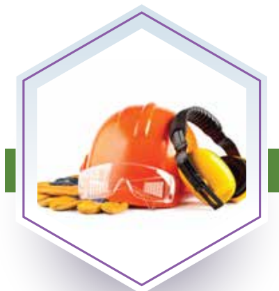
PRÉVENTION DES RISQUES POUR LES TRAVAILLEURS