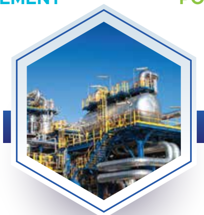
MAITRISE DES RISQUES INDUSTRIELS