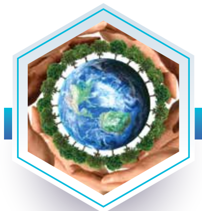
PROTECTION DE L'ENVIRONNEMENT

Générez de la valeur ajoutée en nous confiant la fonction QHSE-RSE. Nos experts réalisent différentes prestations dans les domaines suivants :